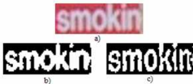
FIG. 5 – a) I , b) M obtenu par la méthode MET, c) I_{finale} par la méthode proposée

Les résultats dépendent surtout de la bonne estimation de l'épaisseur des caractères. Celle-ci est, comme le montrent les premiers chiffres, assez satisfaisante dans 97.7% des cas. Elle est principalement erronée dans les images très bruitées où le masque M est imprécis.