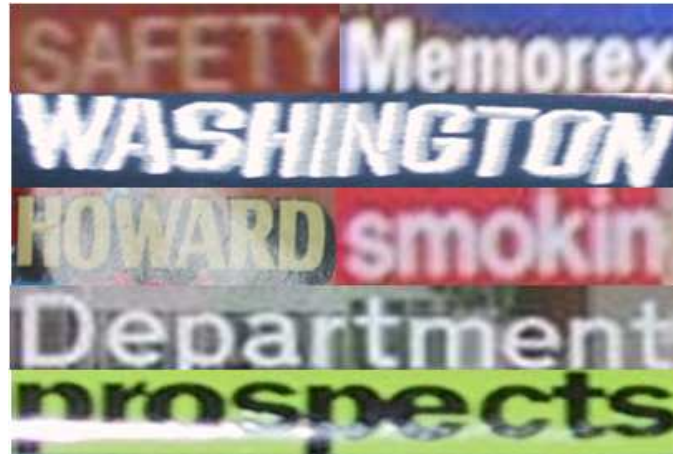
FIG. 1 – Exemples de la base de données publique Icdar 2003 [4]

Les algorithmes trouvés dans la littérature basent leurs tests sur du texte présent dans des flux vidéo principalement [9] en utilisant l’information présente dans les multiples trames disponibles. Cette information est manquante dans le cas d’images fixes, comme celles présentes dans notre base de données (issue de la compétition publique ICDAR 2003) illustrée avec quelques exemples dans Figure 1. La super-segmentation, exercée sur une analyse de documents acquis par scanner et qui a pour but de segmenter les caractères en primitives, a été testée