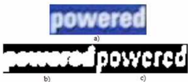
FIG. 4 – a) I , b) M obtenu par binarisation Otsu, c) I_{finale} par la méthode proposée

Sur la base de données d'exemples de mots segmentés [4], et après la méthode MET où 29.2% des images contenaient des caractères collés, l'algorithme de segmentation présenté dans cet article permet de diminuer le nombre de ces images de 76%, pour obtenir alors 7% d'images avec des caractères collés. De plus, seulement 2.3% de fausses alarmes sont constatées permettant de ne pas trop alourdir les traitements sur les caractères cassés dont le nombre n'augmente que légèrement. Un second résultat est illustré dans Figure 4 avec une comparaison avec l'algorithme de seuillage global Otsu [7] qui a également prouvé une grande généralité.