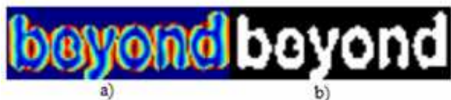
FIG. 3 – a) I_{masque} , b) I_{finale}

Enfin, nous multiplions le masque M par le résultat obtenu précédemment pour obtenir une image I_{masque} (voir Figure 3-a). Nous effectuons ensuite un seuillage S basé sur la méthode classique d'Otsu [7] qui va maximiser la variance inter-classes afin de trouver automatiquement ce seuil. Enfin, nous enlevons cette information inter-caractères éventuelle au masque M pour obtenir l'image finale I_{finale} par I_{finale} = M - (I_{masque} > S) comme sur Figure 3-b.